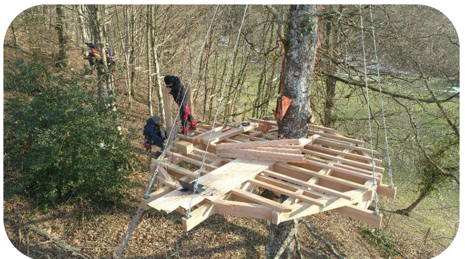
Terrasse perchée à ACCOUS , Construction