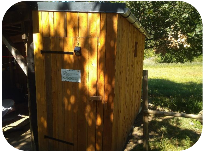
Toilette sèche aire de bivouac SALIEGE à Florac