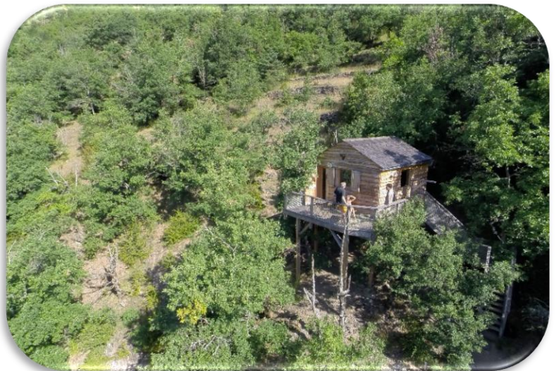
CABANE PERCHEE pour Ma petite cabane en Lozère