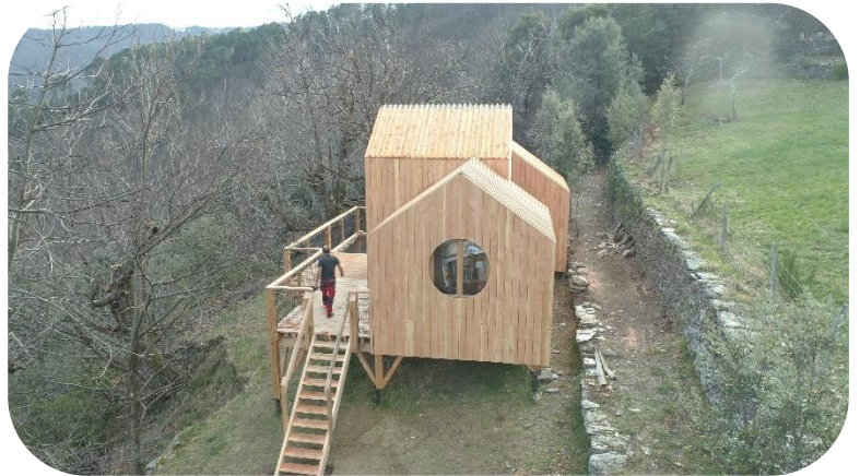
Cabane « nid d'oiseaux » LE VERDIER SAINT MICHEL DE DEZE 48