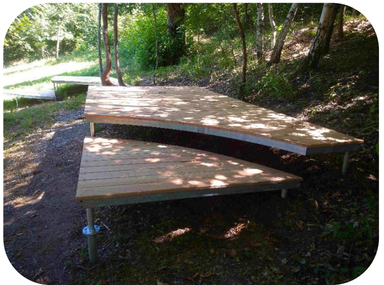
Platelage sur châssis métallique aire de bivouac SALIEGE à Florac